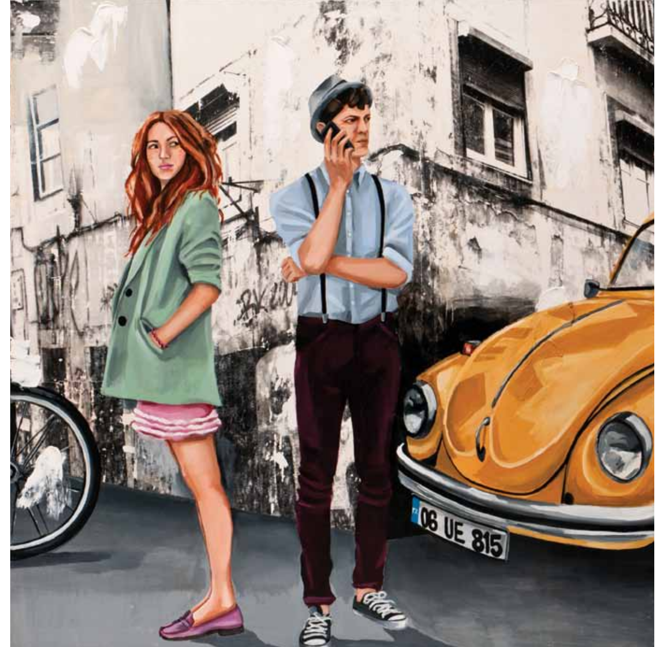
İsimsiz / Untitled Tuval üzerine karışık teknik / Mixed media on canvas 160 x 160 cm / 2012