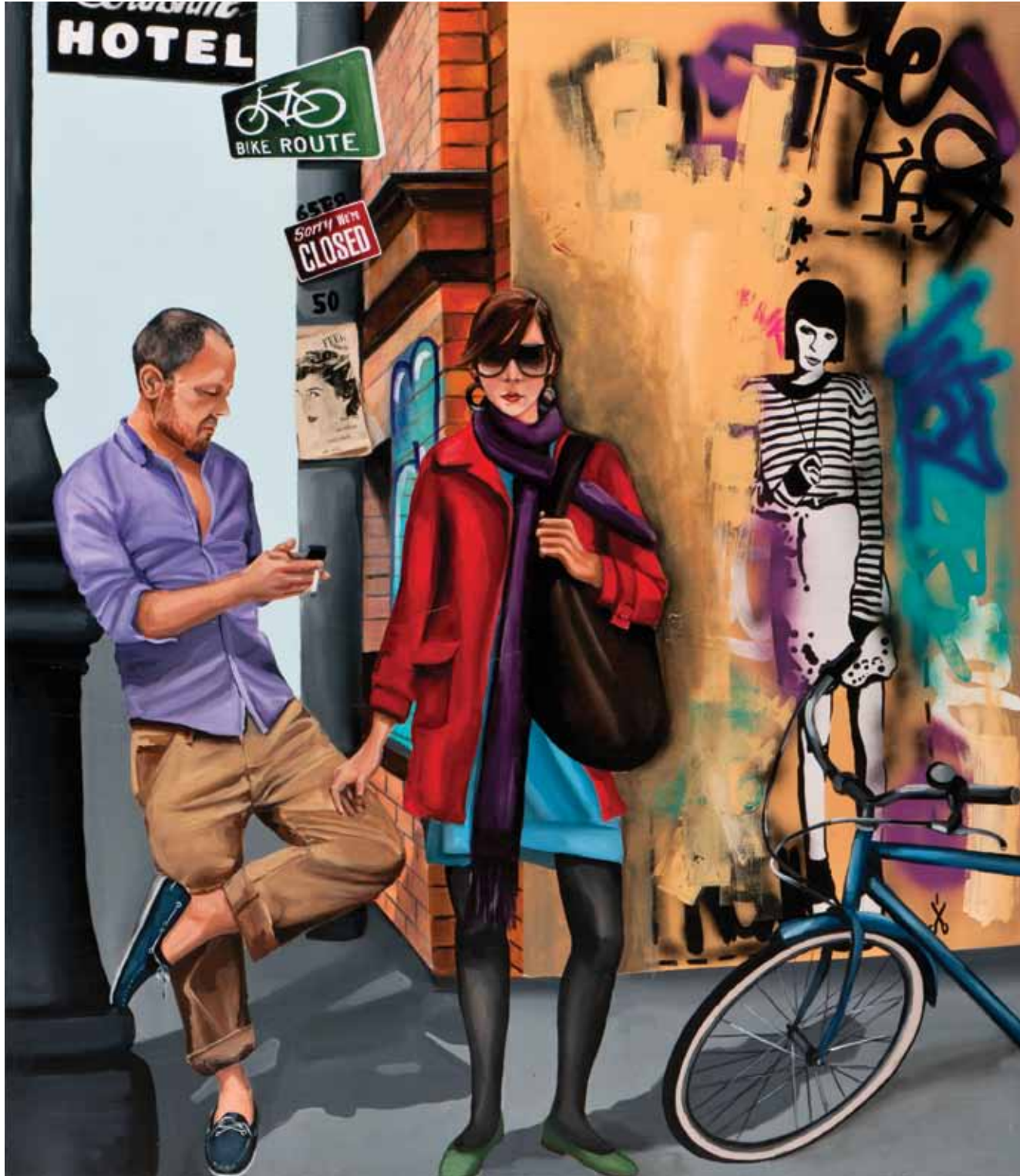
Kusura bakmayın, kapalıyız. / Sorry, we're closed. Tuval üzerine karışık teknik / Mixed media on canvas 160 x 140 cm / 2012