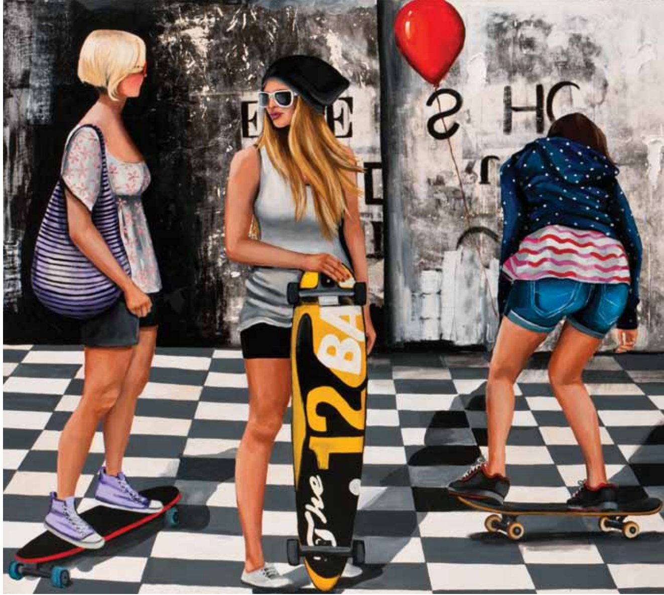
İsimsiz / Untitled Tuval üzerine karışık teknik / Mixed media on canvas 160 x 180 cm / 2012