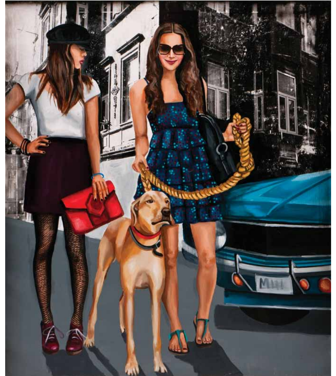
İsimsiz / Untitled Tuval üzerine karışık teknik / Mixed media on canvas 160 x 140 cm / 2012