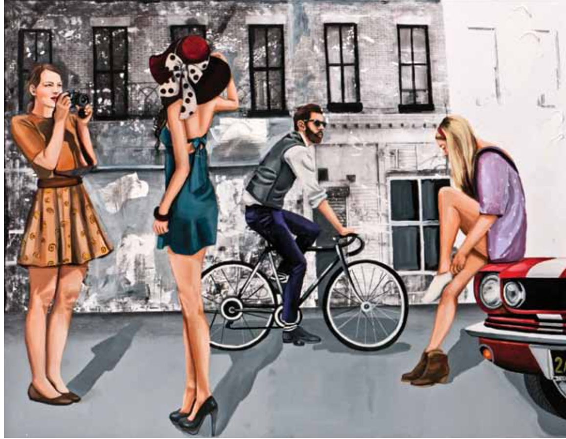
İsimsiz / Untitled Tuval üzerine karışık teknik / Mixed media on canvas 155 x 200 cm / 2012