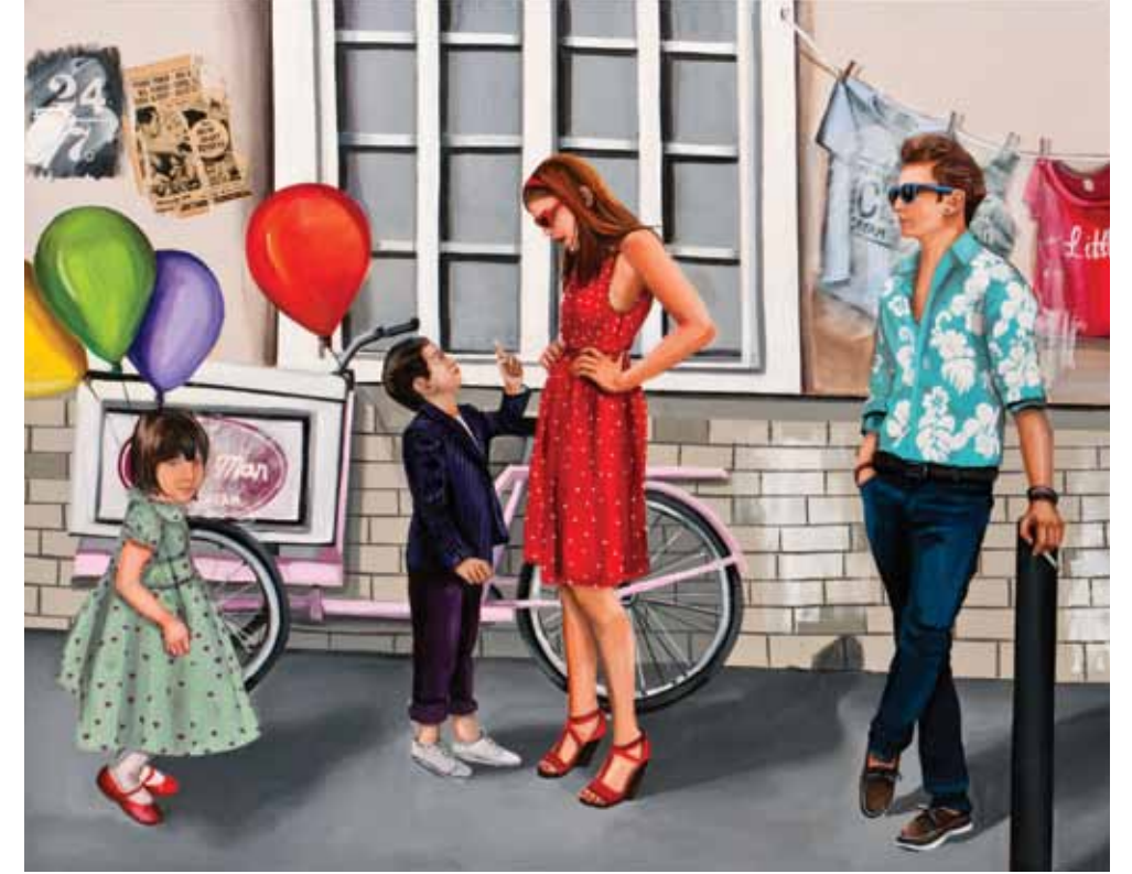
Lütfen, sadece bir tane... / Please, only one... Tuval üzerine karışık teknik / Mixed media on canvas 160 x 200 cm / 2012