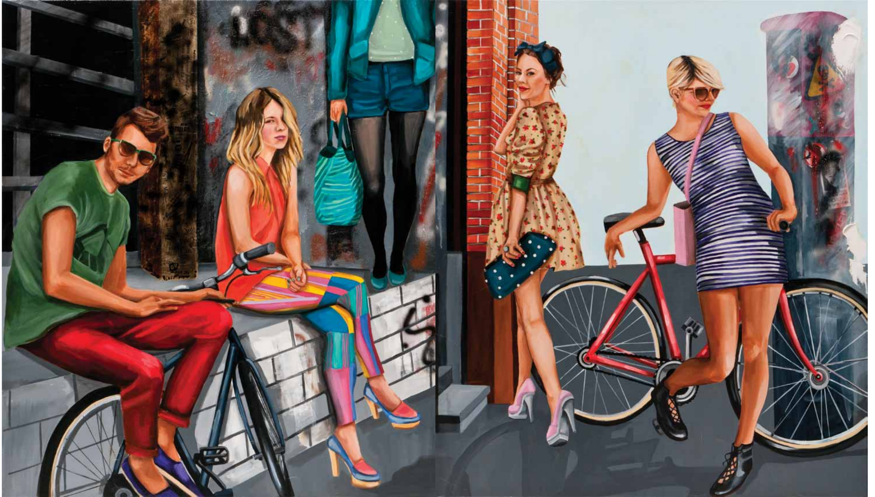
İsimsiz / Untitled Tuval üzerine karışık teknik / Mixed media on canvas 160 x 140 cm / 2012 (diptik / diptych )