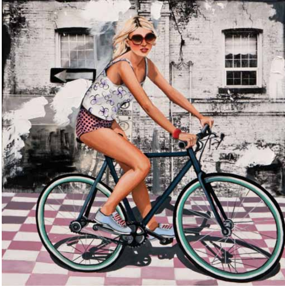
İsimsiz / Untitled Tuval üzerine karışık teknik / Mixed media on canvas 120 x 120 cm / 2012